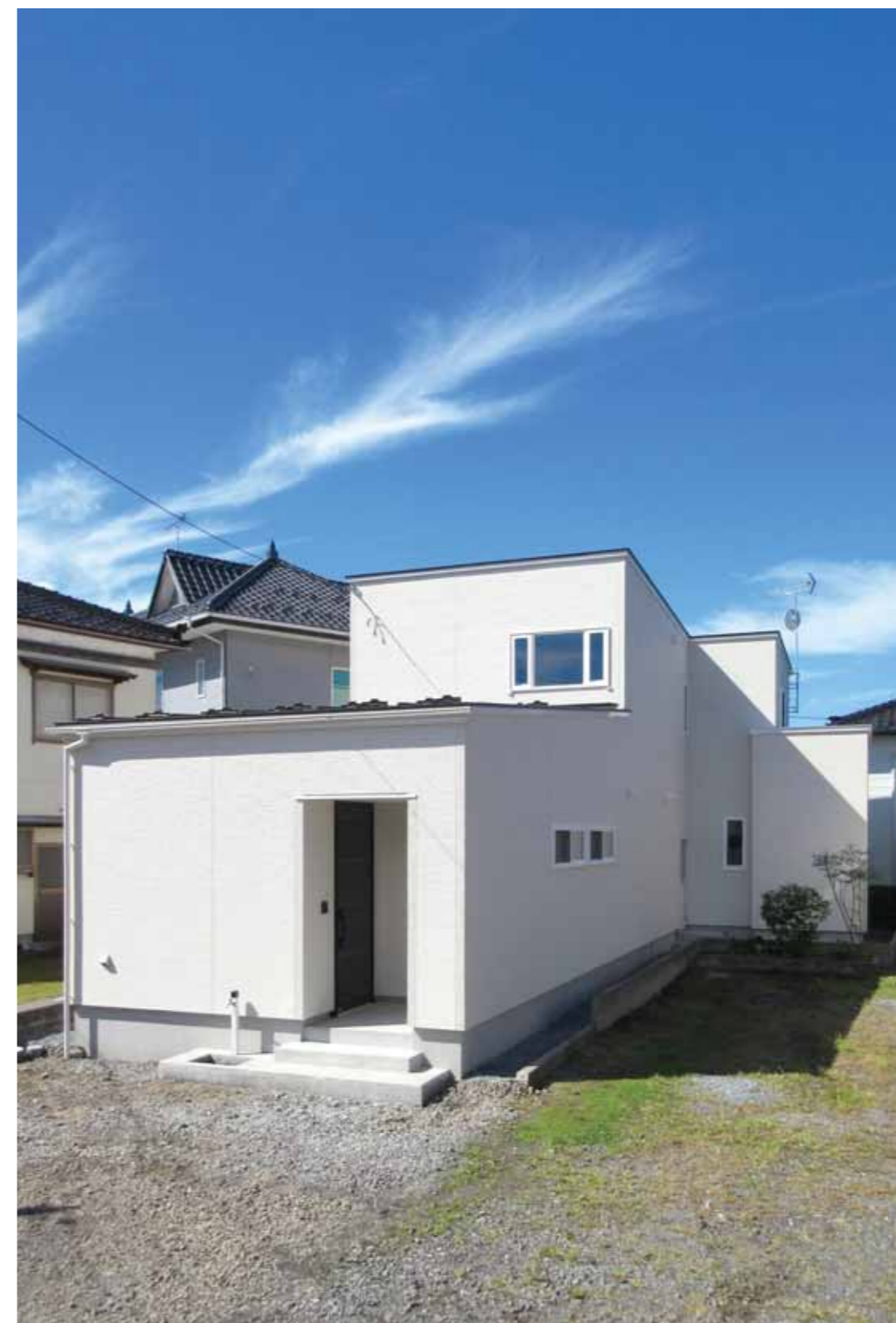
間口6m程の細長くL型に変形した土地。土地の形状に合わせて、建物もL字型に配置しました。

コスモホーム “期待を裏切る” 最高の提案と家づくりを 提供する。パートナーを目指しています