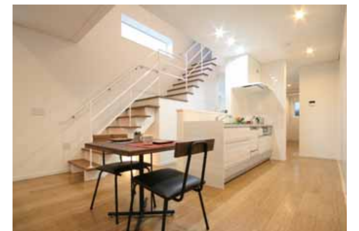
お休みにまとめて家事をすることが多い奥様。キッチンを家の中心に配置し、水回りの動線ができるだけ短くしました。