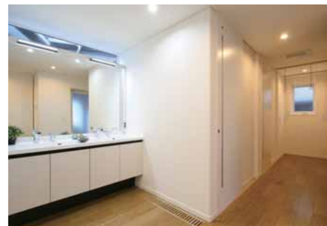
朝の身支度の時間が重なることが多いというご夫婦からのご要望で、洗面台はツインボウルタイプを選択しました。