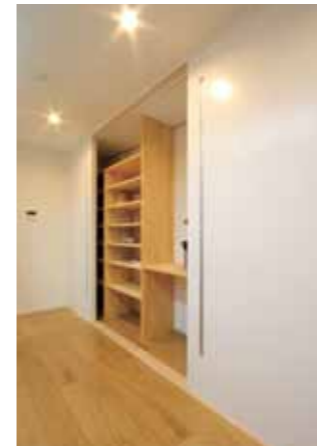
食器や家電をすっきりとしまえるキッチンの収納棚。