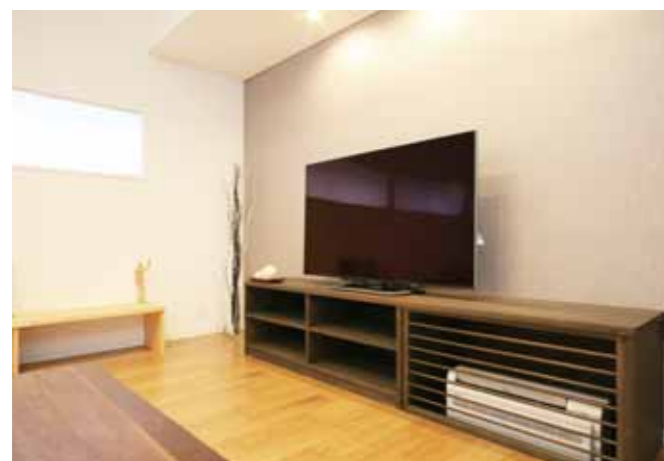
空調は床下エアコンを採用し、室内全体を暖めます。