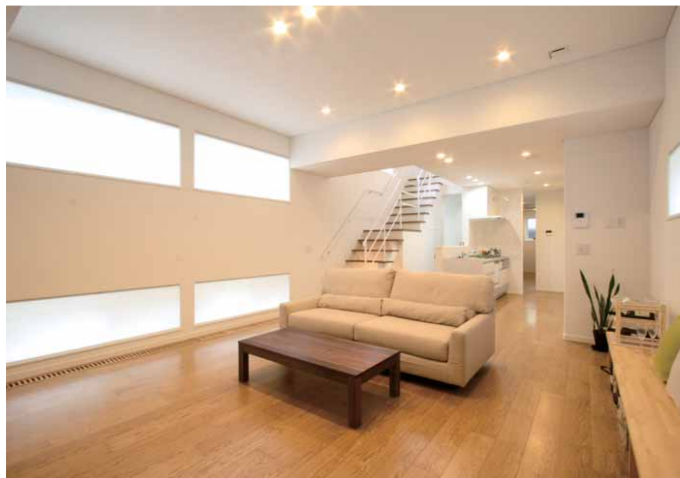
東西に長い敷地を活かしたLDK。

コスモホームは、2000年山形県庄内地方に「高断熱高気密で地元に向った家づくり」がしたいという想いで創業いたしました。当初から新住協に所属し、技術とデザインを追求している住宅会社です。弊社の家づくりは、お客様のご要望をそのまま図面化することはありません。ご要望の中に潜む、家づくりの深い想いを読み取り、お客様が本当にしたい事は何か、どんな家を望んでいるのか、言葉の向こうにある本質を探り、お客様の想像を少し超えた（裏切った）、アイデアと工夫に満ちた提案をいたします。 今回ご紹介するT様邸は、「自宅に友人を招いてホームパーティをしたい」というご夫婦のご要望から「気の合う仲間と賑やかに語り合う家」というテーマを設け、家づくりをはじめました。集いの場になるリビングは、天井高を2.9mと少し高めに設定することで、たくさんの友人が集まってもゆとりを感じられます。 新築を計画したのは間口6mの細長くL字型に変形した土地。南側には隣家の通路がある為、往來の際、目線が合わないようリビングの窓を上下2つに分けて配置しました。窓の位置や間取りを工夫することにより、実際の広さ以上の開放感と明るさが得られています。