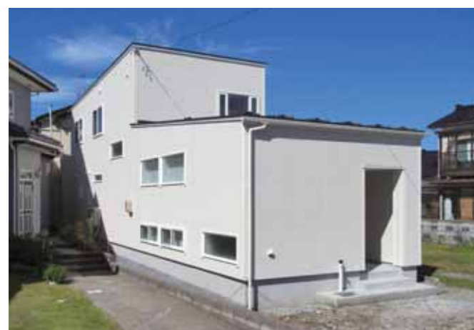
南側の隣家の通路からの視線を遮るために、窓は上下の2つに分ける高さにしました。