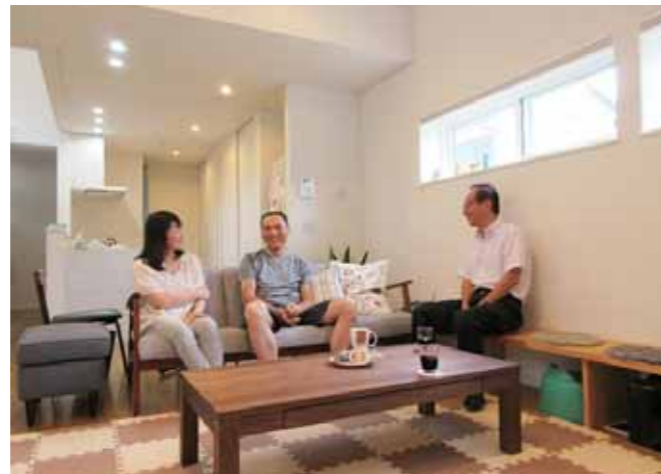
以前の家と比べて冷暖房を使用する期間が短くなったと話すご夫婦。日射の入れ方にも工夫しながら快適に生活していただいています。