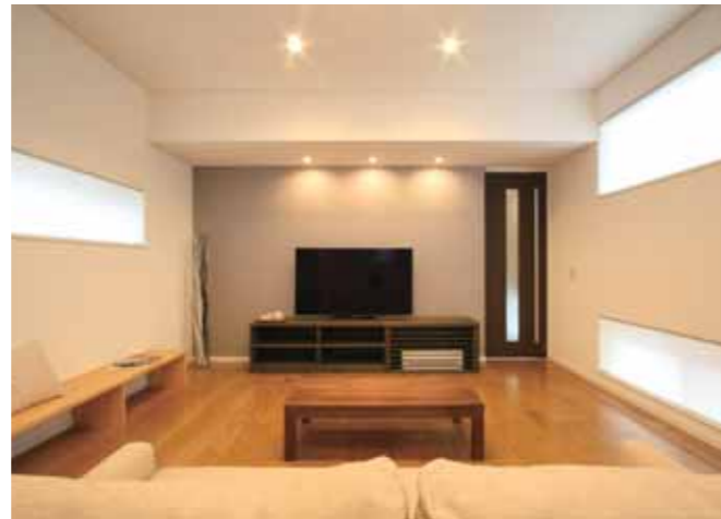
白を基調とした落ち着いた色合いの室内。